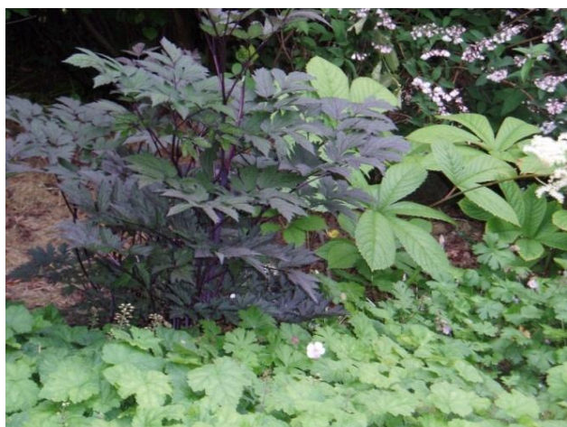
Cimicifuga, Tiarella og Rodgersia