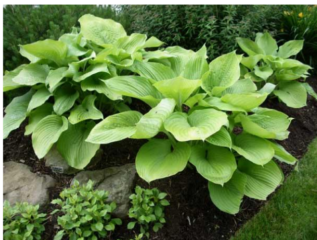
Hosta 'Sum and Substance'